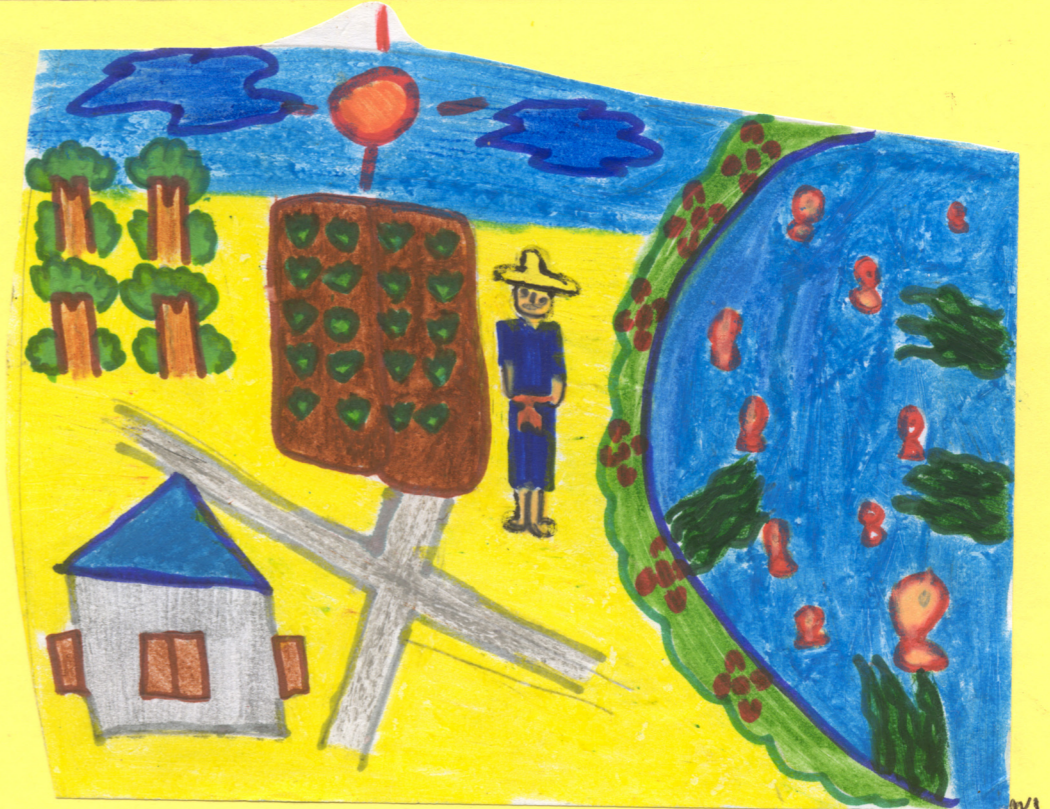
เขียนโดย จ.ป. ชีวิตพอเพียง ภาพโดย กิฟ, สุชัย

มีหมู่บ้านแห่งหนึ่ง ซึ่งมีชีวิตแบบพอเพียง หมู่บ้านแห่งนี้ชื่อหมู่บ้านมวกเหล็ก ซึ่งมีผู้มาประชาสัมพันธ์ ให้ความรู้เกี่ยวกับพอเพียงคือเราต้องรู้จักการประหยัด และไม่ใช้เงินมากใช้เงินน้อยๆ ต่อจากนั้นเรามาเข้าเรื่อง เกี่ยวกับชีวิตแบบพอเพียงกันเลยทีเดียว เราต้องร่วมมือร่วมใจ กันปลูกผักสวนครัวเพื่อลดค่าใช้จ่าย แก่ครัวเรือน และต้อง เลี้ยงสัตว์ไว้ เช่น เลี้ยงปลา ส่วนครอบครัวของหนองก็มีชีวิต แบบพอเพียงเหมือนกัน นั่นก็คือการเลี้ยงปลา- เลี้ยงโคนม เลี้ยงปลา เพราะว่าเวลาปลาโตแล้วสามารถนำไปขายหรือ นำไปทานได้ ส่วนการเลี้ยงโคนมเพื่อนำ นำนมที่รีดจากเต้า วัวแล้วนำไปขายและยังได้รั้งเงินด้วย ต่อจากนั้นเราสามารถ นำเงินที่เราขายของนั้นนำไปเก็บใส่กระปุกออมสินได้ถ้า อยากพอเพียงในการใช้กระปุกออมสินสามารถตัดไม้ได้ ประมาณ 1 ขีด แล้วเจาะรูเล็ก ๆ แล้วหยอดเงิน