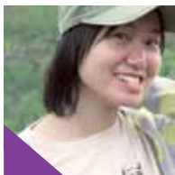
บับเบิ้ล