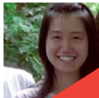
บับเบิ้ล