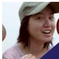
บับเบิ้ล