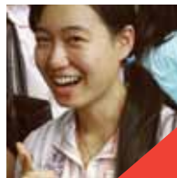
บับเบิ้ล